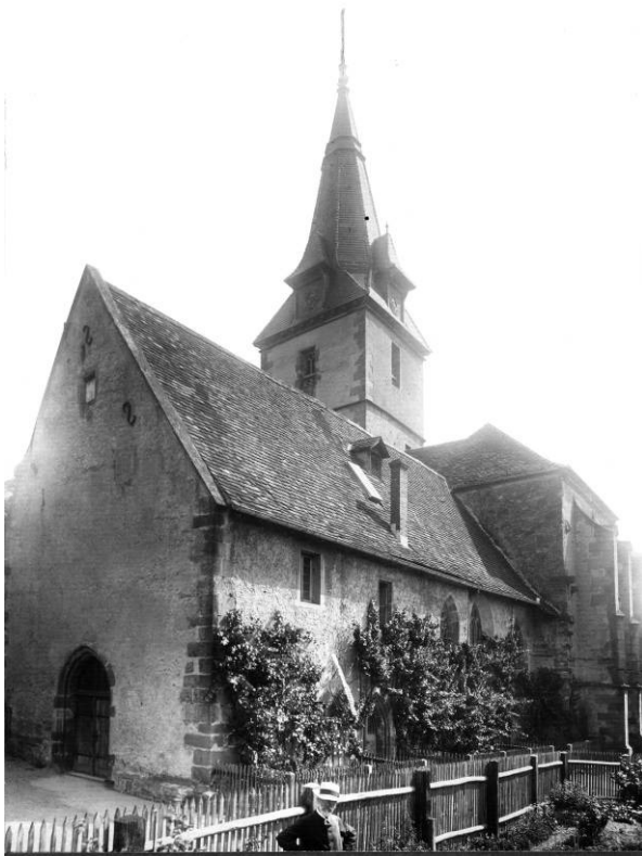
Kornwestheim, St. Martin. Ansicht von Südwesten, um 1910.